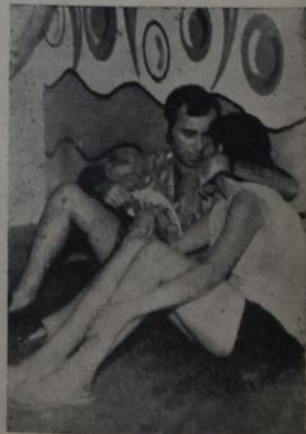
Paz e Amor no "Filhos de Iguaçu"