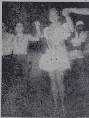
Rainha dos Excursionistas