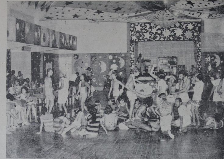
O Carnaval no T.C. Mesquita, foi como de costume, congregando grande parte da Sociedade Mesquitense, com o salão repleto de foliões.