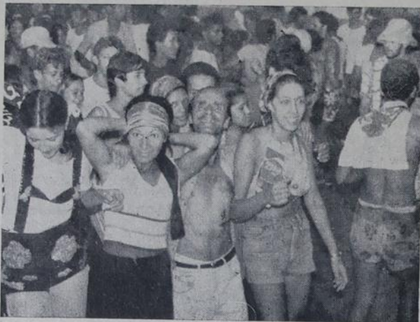
Flagrante do Country Club, onde a alegria foi geral

val, pecando apenas pela falta de conjunto e má coreografia, assim como bastante falhas na harmonia. As Alas das Mulatas, das Liberdas e Beija Flor, foram as que mais se destacaram e arrancaram aplausos da platéia. A alegoria que apresentava a Igreja da Penha com os romeiros e barraquinhas, foi confeccionado com muito carinho e bom gosto, recebendo da assistência os aplausos merecidos.