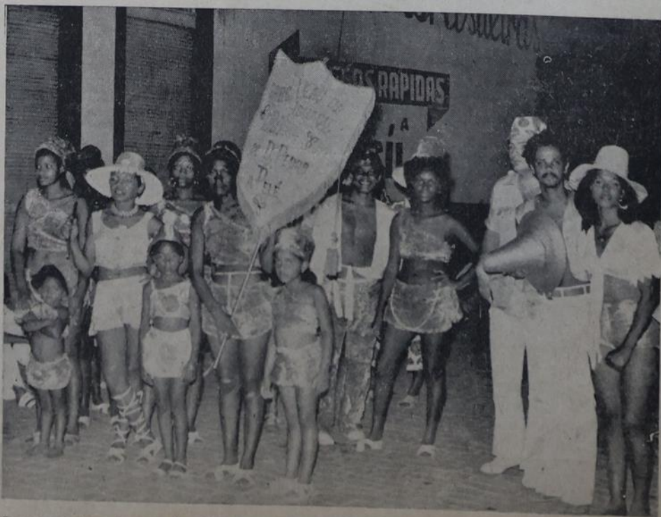
Componentes do popular bloco "Leões de Iguaçu" que deverá abiscoitar a primeira colocação depois da brilhante apresentação na Praça Onze.