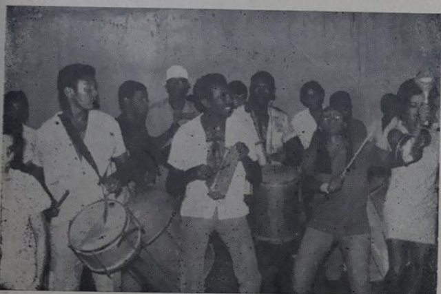
Vibrante Bateria do Unidos do Farrula.