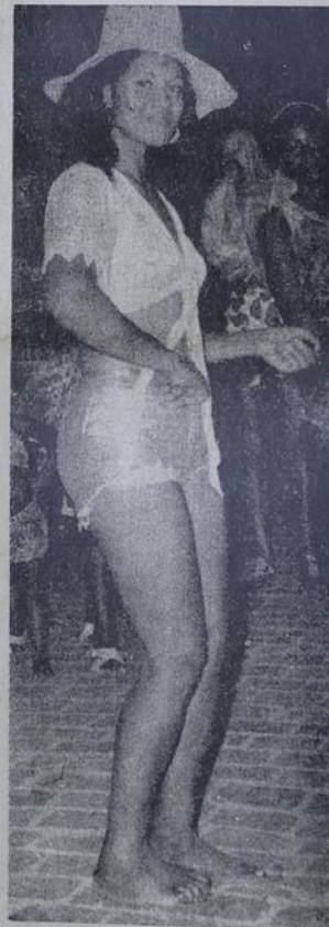
A mulata do "Leões de Iguaçu" em pose especial