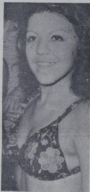
A boneca da foto não perdeu tempo, brincou os quatro dias no simpático Clube dos "40", em Belford Roxo.