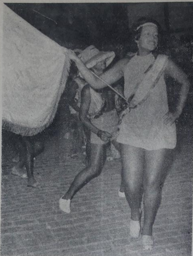
Mesmo sem tablado, as meninas do samba deixaram cair sobre pedras.