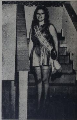
Reinado no Recreativo