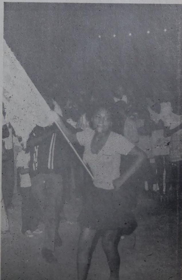
A porta-bandeira e o mestre sala da União da Mocidade de Areia Branca vêm com força total, para conquistar o título de Campeão de 72.

Dentro do enredo, os garotos que desfilarão, no Satélite, venderão simbolicamente, jornais e amendoim torradinho, numa inovação do bloco.