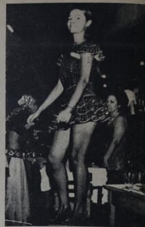
Alegria no "500"