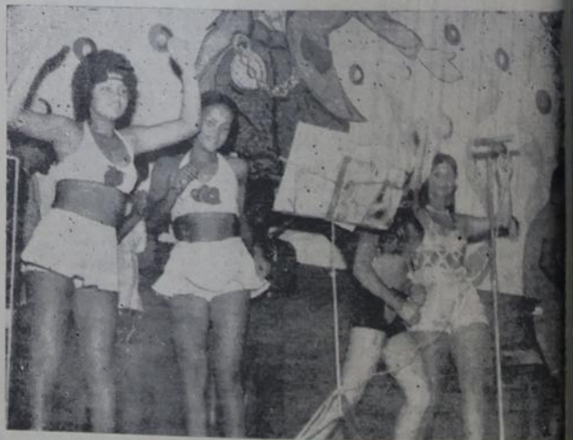
No Mesquita F. C. o Carnaval teve extraordinária movimentação, com ordem e bastante alegria, fazendo-se sentir, a presença de sua diretoria.

Evidentemente que a maioria que se comprimia ao longo das principais avenidas da Baixada, era constituída de meros espectadores e seu número, podemos presumir, pode se elevar a cerca de 600 mil.