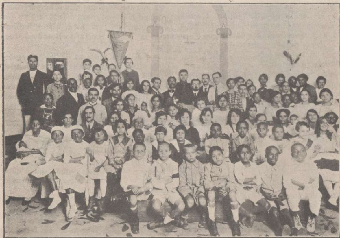
CONGREGAÇÃO PRESBYTERIANA DE MADUREIRA