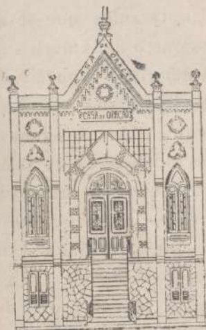
Nova Casa de Oração, em Ramos (Suburbio da Leopoldina.)