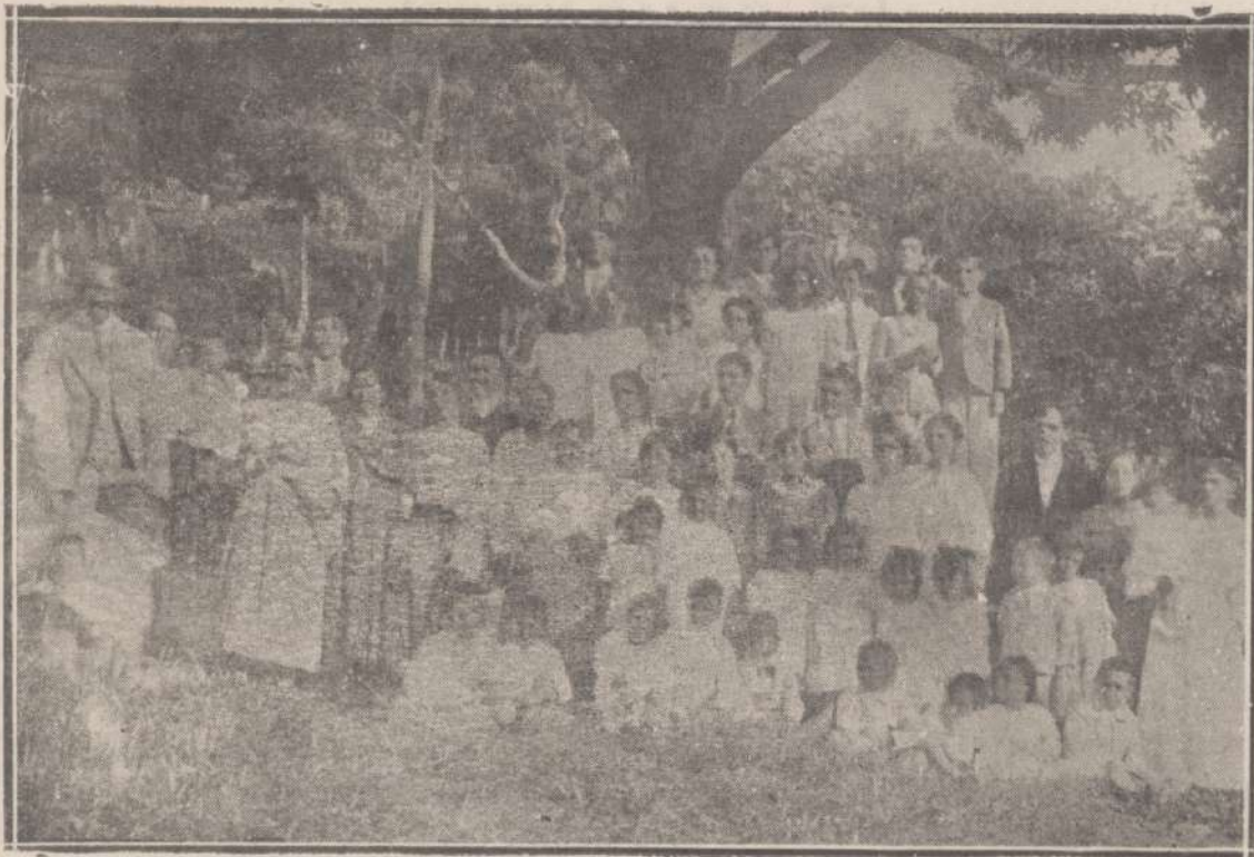
Grupo da Congregação de Ramos, que por estes dias vae inaugurar seu templo

3. — No mesmo solo bom ha differença na producção : trinta, sessenta e cento por um.