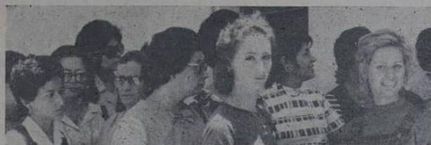
Inúmeras professoras estiveram presentes às solenidades de instalação do Setor Regional da Campanha Nacional de Alimentação Escolar, em Nova Iguaçu.