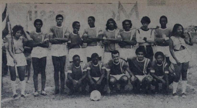
A Seleção de Cabuçu teve o incentivo de sua torcida organizada, não faltando belas garotas e uma furiosa bateria, e acabou liquidando com a brava equipe do Regimento Sampaio, numa festa que contou com a presença de inúmeras personalidades do Município