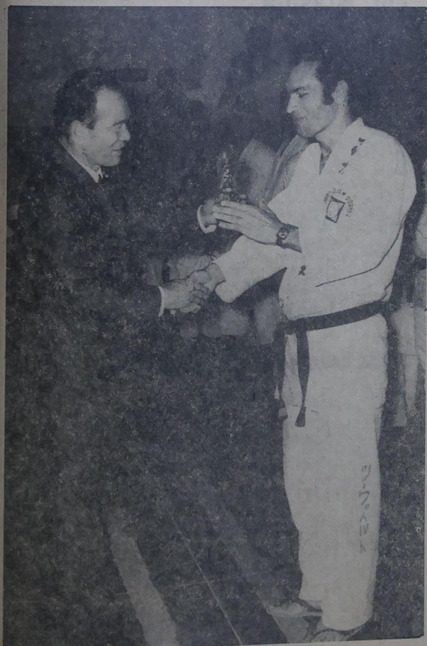
O Judô Clube M. Soares foi o campeão do desfile da abertura. Antes chamava-se Academia. Agora trocou as cores do escudo. Melhorou.